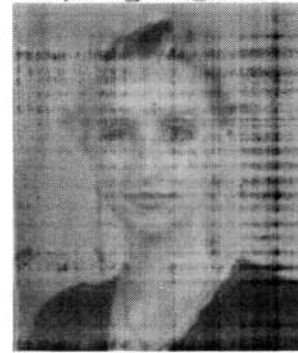
к.ю.н., доцент, Сумська філія Харківського національного університету внутрішніх справ

У статті пропонується визначити адитивними освітніми технологіями сучасні технології, що спрямовані на ефективне отримання і засвоєння навичок та вмінь, а також стійкої мотивації до вирішення практичних задач в професійній діяльності, закріплення отриманого ефекту на довгостроковий період. Адитивні технології розглядаються як комплексний, інтегративний процес, що включає в себе людей, ідеї, засоби і способи організації освітньої діяльності для планування, забезпечення, оцінювання набутих професійних навиків на основі засвоєних знань.