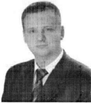
к.е.н., доцент, Сумська філія Харківського національного університету внутрішніх справ